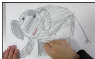
過去に開催した“中級”の様子