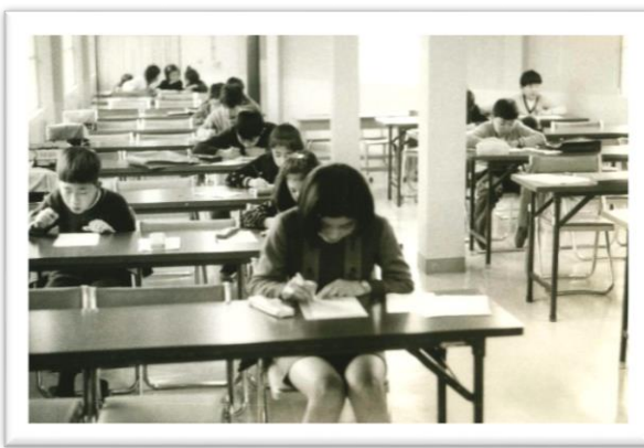
40数年前の石橋の旧教室での小学生の学習風景。当時は豊中と石橋の2カ所に教室がありました。ごこう学習研究会の加盟教室が全国に一時期22教室もあった時代で当時の中心は、まだ小学生と中学生の算数と数学の学習教室でした。