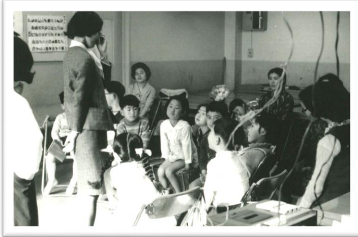
当初は小中高生の算数と数学の専門塾でした。写真は 50 年程前の豊中で幼児教室や英語教室も本格的に始めた頃。