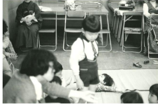
昔の幼児教室の運動のおけいこの風景。床にござを敷いて取り組んでいた様です。参観している保護者の中には着物の方(左上)もいらっしゃいます。