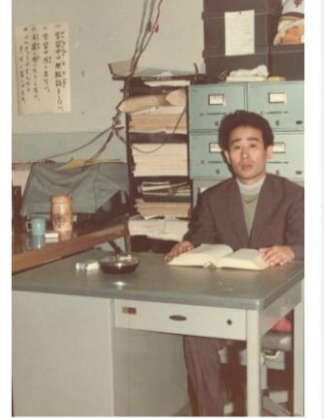
30代の頃のおじいさん先生。おじいさん先生が大学生の時に塾は始まりました。