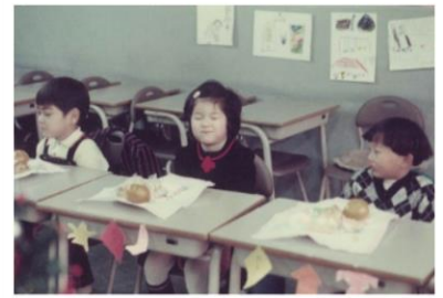
おけいこが終わった後は、おやつ時間もあった様です。